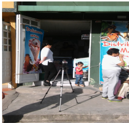
Fotografía No. 4 Registro punto de monitoreo de los niveles de presión sonora