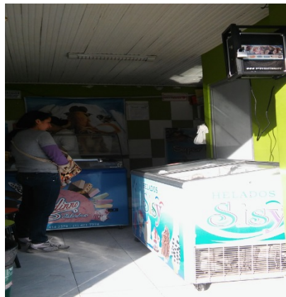
Fotografía No. 5 vista al interior del establecimiento DISTRIBUIDORA EL MAMUT